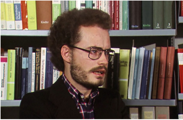
Abb. 2 ◀ Volkmar Sigusch 1940–2023